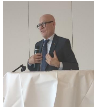
Festrede Prof. Dr. Dr. Udo Di Fabio, Bundesverfassungsrichter a.D.

‘Würde und Freiheit im Verfassungsrecht – wieviel Kant steckt im Grundgesetz?’